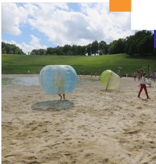
Animation plan d'eau