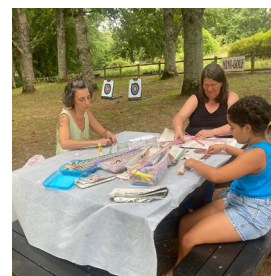
Eté actif et solidaire

Centre social culturel et sportif de Haute - Charente 39 rue du 8 mai - Roumazières - Loubert 16270 - Terres-de-Haute-Charente